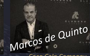
Marcos de Quinto