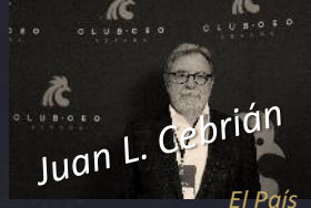
Juan L. Cebrían